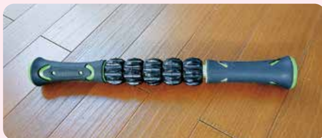
愛用の筋膜リリースローラー

学生のみなさんも、同じ姿勢でパソコンやスマホに向かう時間がかかなり多いと思います。肩や首のこりや、じっと座っていることにより、血流(リンパの流れ)も滞りやすくなるので一度試してみたいかたがたでしょうか。そして免疫力をアップして病気にかからないように気をつけて乗り切っていきましょう!