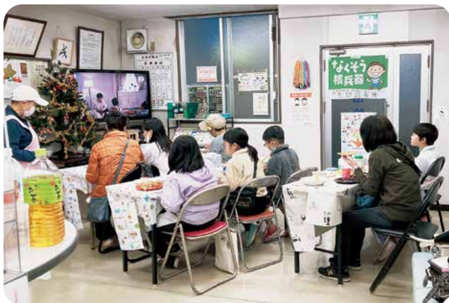
子ども食堂は毎月第3木曜日に開催しています

診療所での勤務も長くなり、生田診療所の患者さんや地域の方にも親しく声をかけてくださることが増えてきました。患者さんの言葉に癒やされたり、元気をもらったり、人との繋がりの大切さを実感する日々です。これからも患者さんとの関わりの中で、小さな変化や気になることを見逃さないように、患者さんに寄り添えるように頑張りたいです。